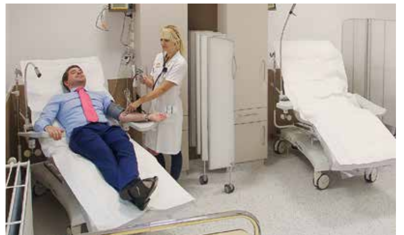
In der Tagesklinik der Wiener Privatklinik werden den Patienten modernste tagesklinische Diagnose- und Therapieverfahren angeboten.