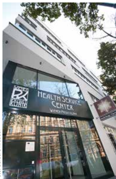
Das Health Service Center an der Wiener Privatklinik: Zugang von der Lazarettgasse.

Im Health Service Center der Wiener Privatklinik in der Wiener Lazarettgasse finden Sie die Ordinationen zahlreicher Spitzenmediziner. Auch das topmoderne Radiology Center steht Ihnen zur Verfügung.