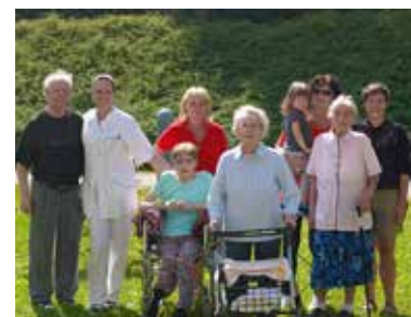
Die Senioren freuen sich schon darauf, im Garten aktiv werden zu können.

„Viele unserer Senioren freuen sich schon richtig darauf, im Garten aktiv zu werden. Die Pflanzen zu gießen