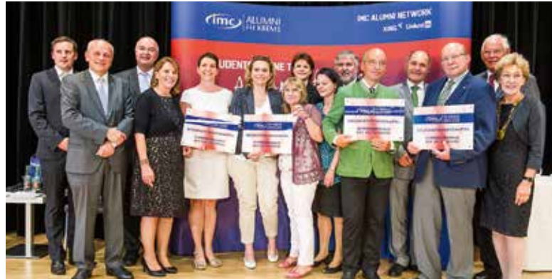
Die Wiener Privatklinik wurde im Juli von der IMC Fachhochschule Krems als „Lehrkrankenhaus“ ausgezeichnet.

„Derzeit gibt es zwei Ausbildungsschienen für Pflegepersonal: die Schule für allgemeine Gesundheits- und Krankenpflege und den Fach-