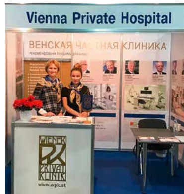
Die WPK auf einem Workshop in Moskau (links) und auf einer Messe in Kiew (rechts).

Obwohl sich in Russland und in der Ukraine die Gesundheitsland-