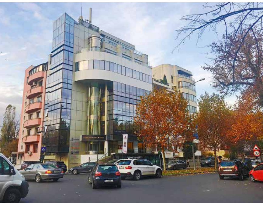
Das Büro der Wiener Privatklinik in Bukarest ist in einem repräsentativen modernen Gebäude untergebracht.