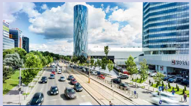
AKTIVITÄTEN DER WPK IM AUSLAND