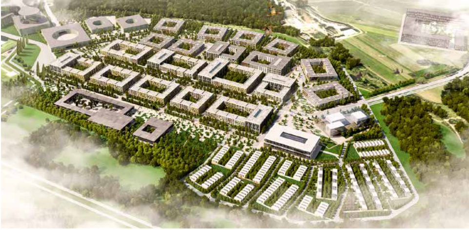
Das Innovationszentrum Skolkowo bei Moskau, bei dem Medizin einen wichtigen Platz einnimmt, ist ein Symbol für den Aufschwung des russischen Gesundheitssektors.