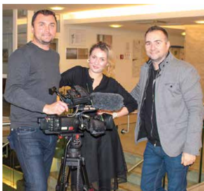
Journalisten aus Rumänien zu Besuch an der Wiener Privatklinik.

Zum zweiten Mal besuchte soeben eine Delegation rumänischer Journalisten von TV- und Radiosendern die WPK. Sie erhielten eine exklusive Führung durch die gesamte Kli-