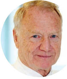
Университетски професор д-р Райнър Котц

„Една от целите ми е да запазя и реконструирам крайниците на нашите пациенти.“