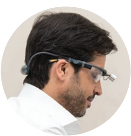
д-р Алексис Фрайтас, член на Европейския съвет по хирургия

"Хирургията и колопроктологията запазват живота и качеството на живот. Не само по отношение на лечението на заболяванията, но и по отношение на превенцията!"