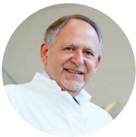
Унив. проф. д-р почетен д-р Кристоф Цилински

“Интердисциплинарното сътрудничество в различни области, като рентгенология, патология, хирургия, вътрешна онкология и лъчетерапия, е от решаващо значение.”